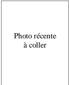
Photo récente à coller

LICENCE 2013 ESCRIME Fitness / Artistique